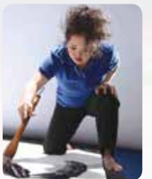
書: 金澤 翔子