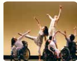
みんなのダンス・フィールド