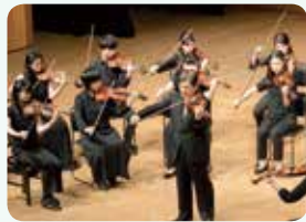
昨年度ミュージック・イン・ザ・ ダークの様子