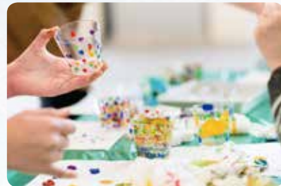
昨年度ワークショップの様子

本学演奏芸術センター開設授業「障がいとアーツ」 受講生による企画。完成した作品は、障がいを超える ダンス「Note -わたしの物語-」の舞台セットとな り、公演を彩ります。