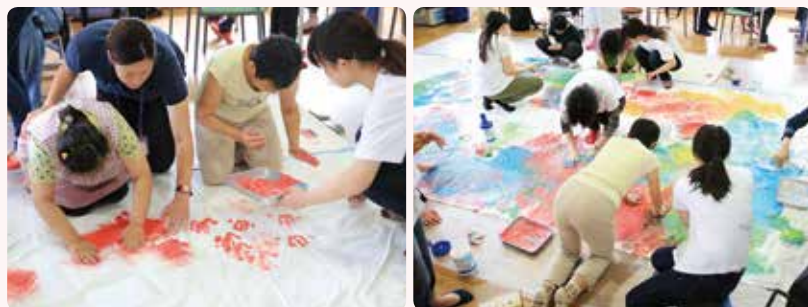
表紙作品の制作風景 (社会福祉法人愛成会 アトリエぱんげあでの障がいとアート受講生によるワークショップ)