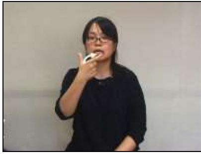
1.『装着』: 補綴物を装着する様子を表現する。