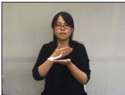
1.手の甲で手のひらの上を払う様子 子を表現する。