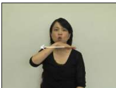
1.「床」:手の甲を上にして水平に動かす。