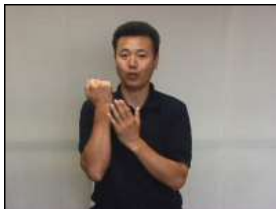
1.歯に見立てた拳を軽くたたき、