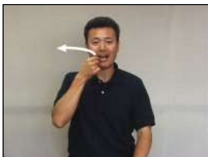
1.歯をつまんで抜く様子を表現する。