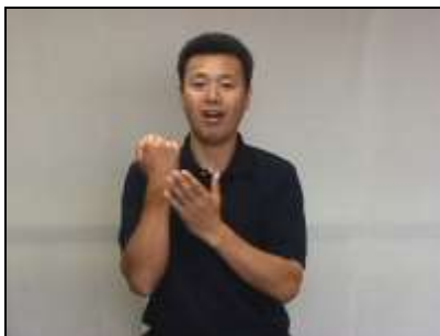
1.歯に見立てた拳を軽くたたき、