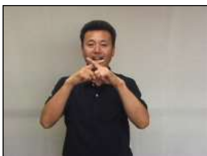
人差し指を交差させる。