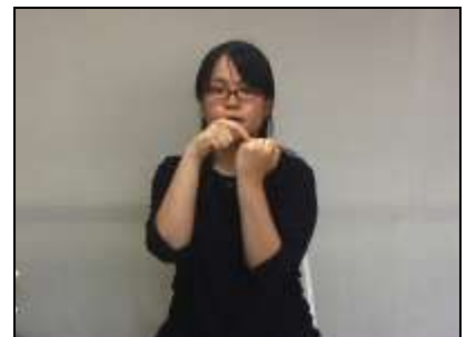
一方の歯冠部を人差し指で指す。