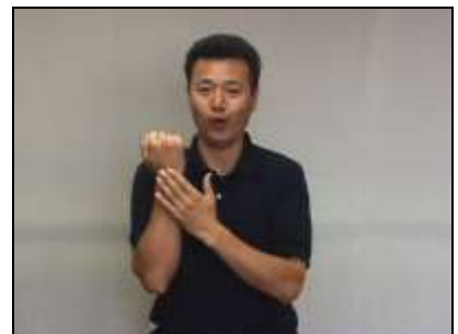
2.歯面がベタベタしている様子を表現する。