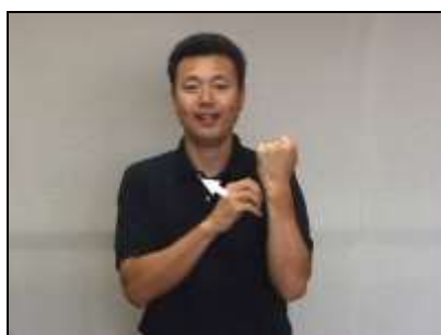
1.歯肉が腫れ上がる様子を表現する。