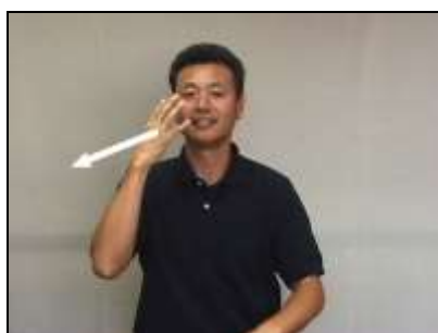
1.X線撮影の様子を表現する。