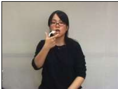
1.補綴物を装着する様子を表現する。