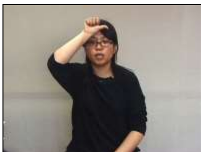
手を「ア」にして「病気」。