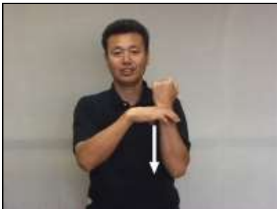
1.手を歯と歯肉に見立て、歯肉が下がる様子を表現する。