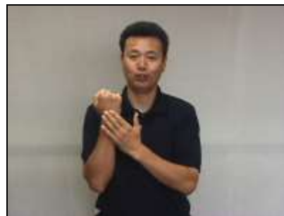
2.歯面がベタベタしている様子を表現する。