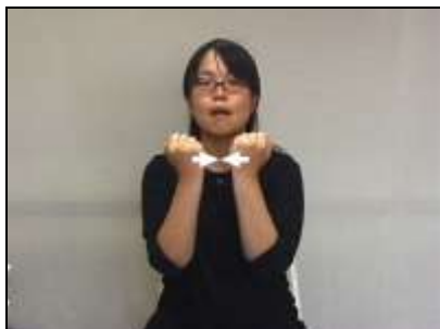
1. 歯に見立てた両腕の拳を接触させる。