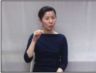
1.「粉」: 指先をすり合わせる。