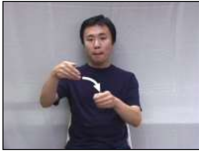
1.『埋没』: 鑄造リングに鑄型材を流し込む様子表現する。