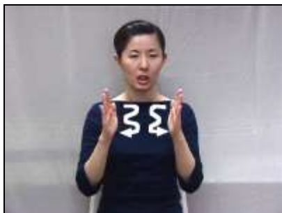
1.クッションが間に入っている様子を表現する。