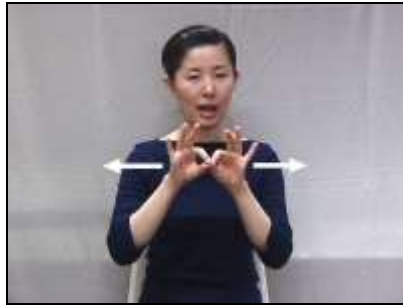
1.『線』: 細いものが左右に伸びている様子を表現する。