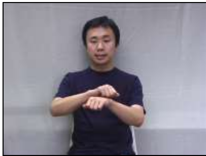
1.拳の甲を拳でこする。