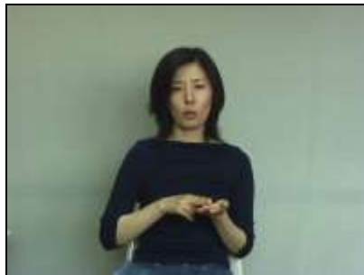
1.二本指でセメントを練る様子を表現する。