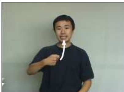
1.トレーを口腔内に運ぶ動作を表現する。