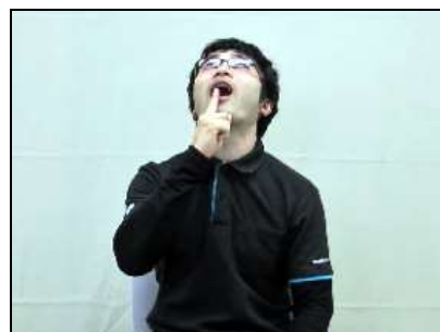
口蓋の切歯乳頭を指す。