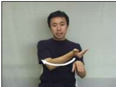
1.両手の甲で上下顎の歯槽を表現し、