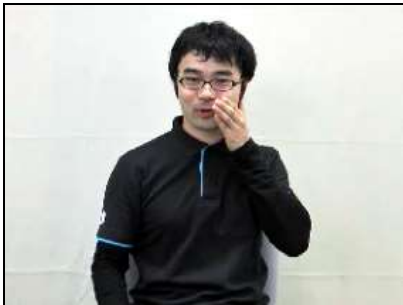
片手を下顎に見立て、