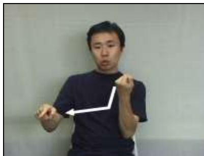
人差し指で鉤脚を描く。