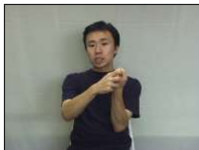
『クラップ』: 拳を親指と人差し指で上からかぶせてつかむ。