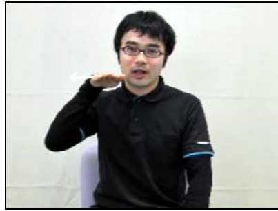
1.口の横で手を水平に動かし頬棚を表す。