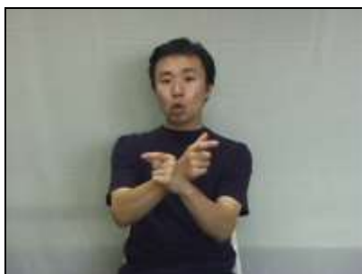
双子鉤の形状を表現する。