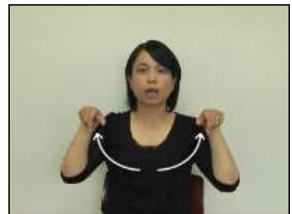
『顎堤』:C字型にした手を馬蹄形に動かす。