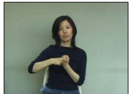
クラSPが作用している様子を表現する。