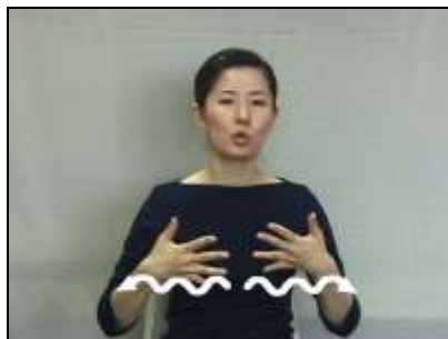
1.開いた両手を波打つように外側へ移動する。