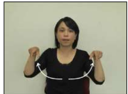
『顎堤』:C字型にした手を馬蹄形に動かす。