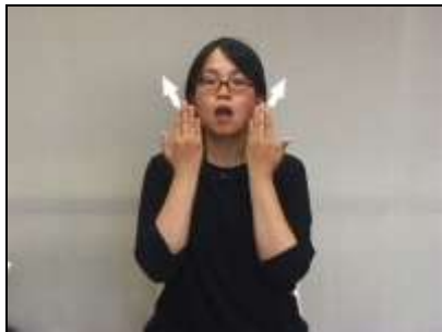
両手のひらを頬から後方へ動か し、臼歯部を表現する。