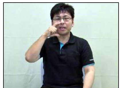
口の横で親指と人差し指で咬合高径を表す。