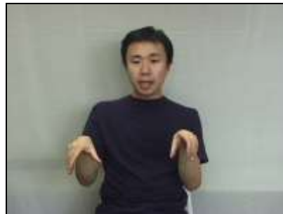
2. 顎堤の形状を表現する。