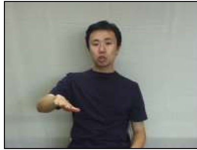
2.下に膨らむアーチを描く。