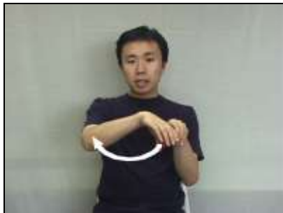
1. C字型にした手を馬蹄形に動かし、