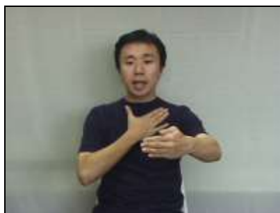
胸のあたりに手を置く。