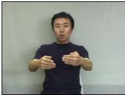
両腕を二腕鉤に見立てる。