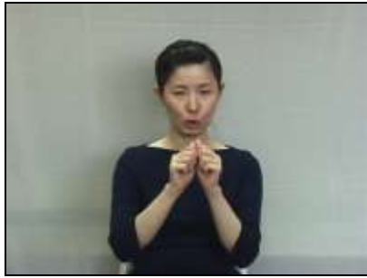
1.バーを屈曲する動作を表現する。