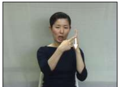
人差し指でラインを描く。