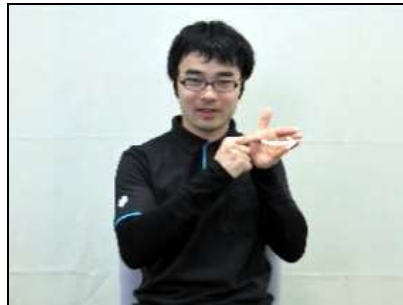
1.顎舌骨筋線部分をなぞる。