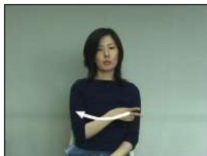
1.「パ」で前方に弧を描き、