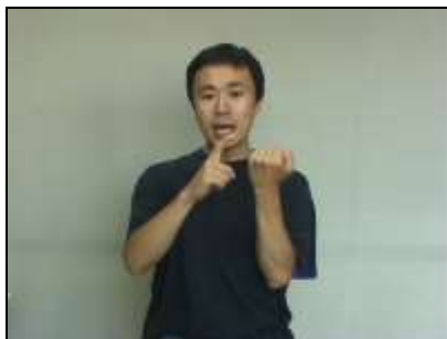
1. 歯に見立てた拳の上に曲げた人差し指を引っかける。