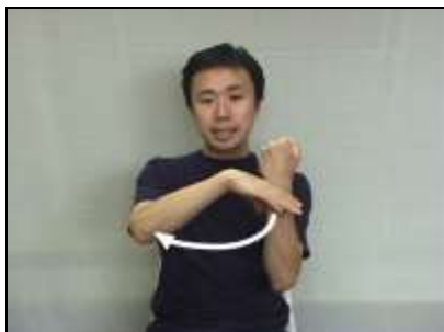
1. 片手を歯に見立て、反対の手で『顎堤』を表現する。