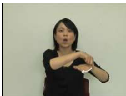
1.床縁部分を人差し指でなぞる。