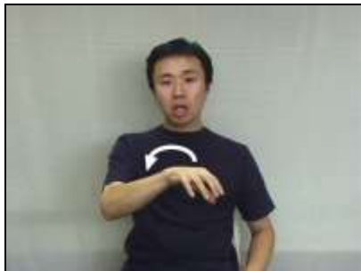
「場所」「(少し位置を変えて)場所」 『床』