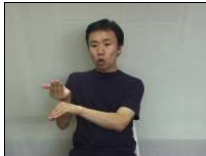
2.そのまま馬蹄形を描く。