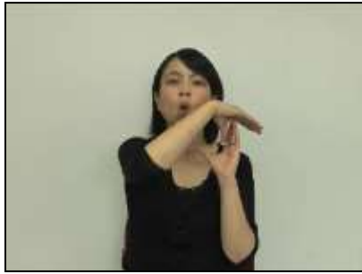
1.正常咬合の状態を表し、