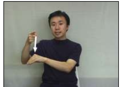
歯槽頂を結ぶ線を表現する。