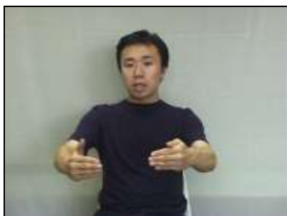
両腕を二腕鉤に見立てる。