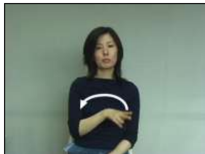
1.「パ」で上方に弧を描き、