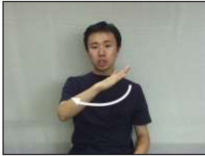
1.『床』:手のひらを下に向け、