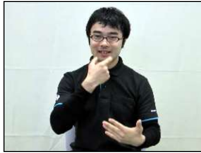
「仮」:親指と人差し指で輪を作り、手の甲にあてる。 『義歯』