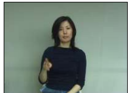
2.パラタルバーの形状を表現する。