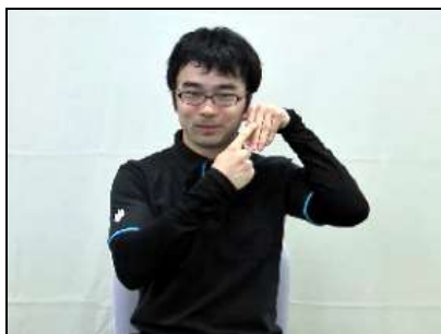
パッドをつくり、指す。