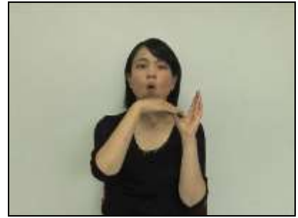
交叉咬合の状態を表す。