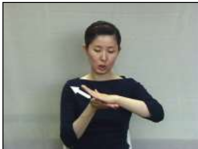
1.両手を上下に合わせ、下の手を側方へ動かす。