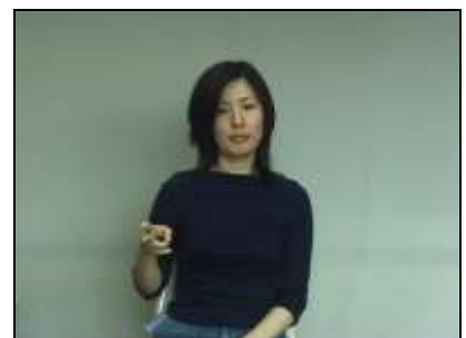
2.リンガルバーの形状を表現する。