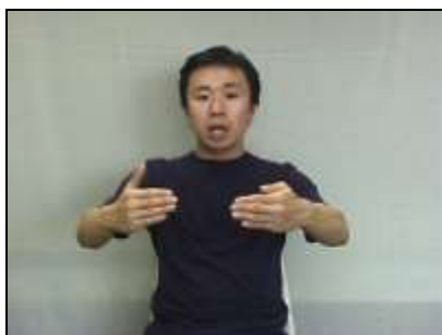
両腕を二腕鉤に見立てる。