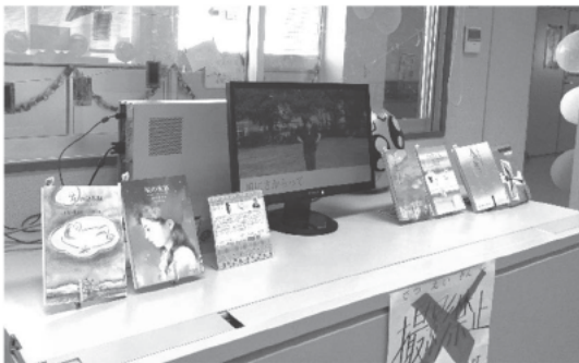
Fig. 4 文化祭展示の様子

完成した映像は、生徒の承諾を得てWEB上にアップロードし、文化祭で展示した。(Fig. 4 参照)