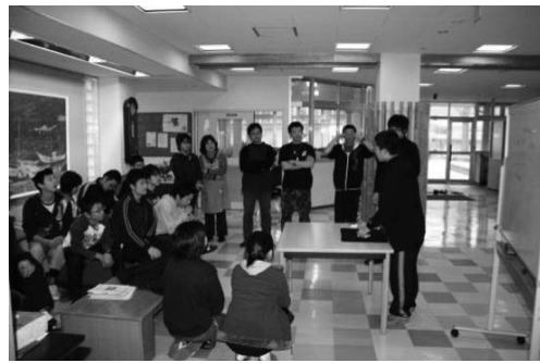
写真4 舎生がマジックを披露

3月23日、卒業式、修了式後の帰省に当たっても、計画停電による交通機関の混乱が続いていたために、保護者が同伴できない舎生には、最寄りのターミナル駅や空港まで寄宿舍指導員が引率をした。