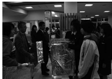
写真2 毛布配布の様子