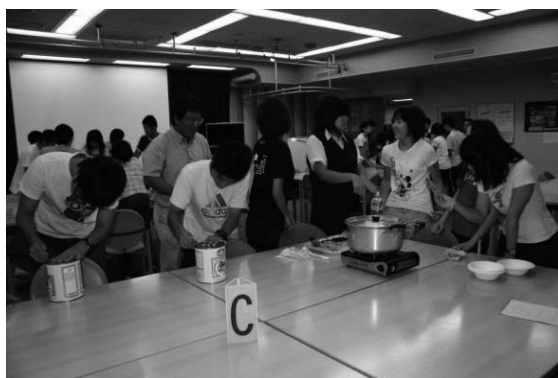
写真８ 非常食を作っている様子

今回は東日本大震災の時に摂ったスープとビスケットを用意した。ビスケットは味がついていないので、学校で常備している乾パンについているチョコクリームを模倣して寄宿舍でも同様のものを用意した。３種類のスープをそれぞれレシピ通りに調理したが、缶切りが使えない、カセットコンロの使い方がわからなく戸惑っていた舎生がかなりいたことに驚いた。