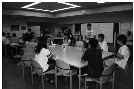
写真7 グループ討論の様子