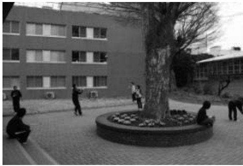
写真3 寄宿舍前でレク