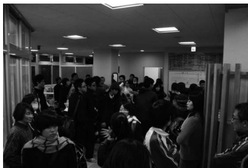
写真1 通学生受け入れの様子