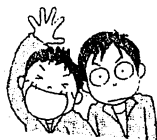
健康に関する質問