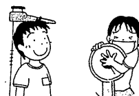
身体計測・視力検査 などができます