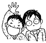
健康に関する質問