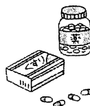
内服薬(飲み薬) をわたすこと