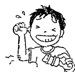
けがの手当を 続けること