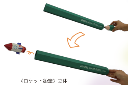
《ロケット鉛筆》立体

造形芸術科は全国の聾学校の中で唯一の芸術系の専攻科です。高等学校を卒業後、2年間の課程でデザインや絵画の基礎や造形に関する幅広い内容を学びます。生徒は毎年全国規模の展覧会に数多く出品し入選、受賞の実績を積み重ねています。また外部機関の依頼を受けてポスター制作やロゴデザイン、キャラクターデザインを行うなど特色ある学習活動を行っています。