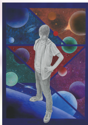
《希望》イラストレーション

本展では、筑波大学附属聴覚特別支援学校の高等部専攻科 造形芸術科2年生が制作した多様な作品を約75点展示します。2年間という短い期間でしたが、お互いに切磋琢磨して制作活動に取り組んでまいりました。3人の個性あふれる作品をお楽しみください。