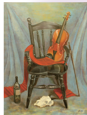
《西洋貴族の演奏》油彩